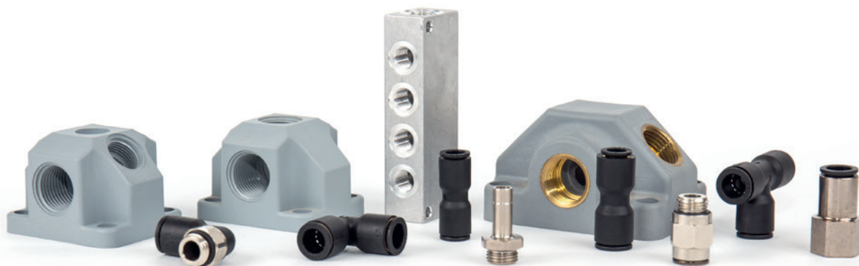
Rohr AD 1